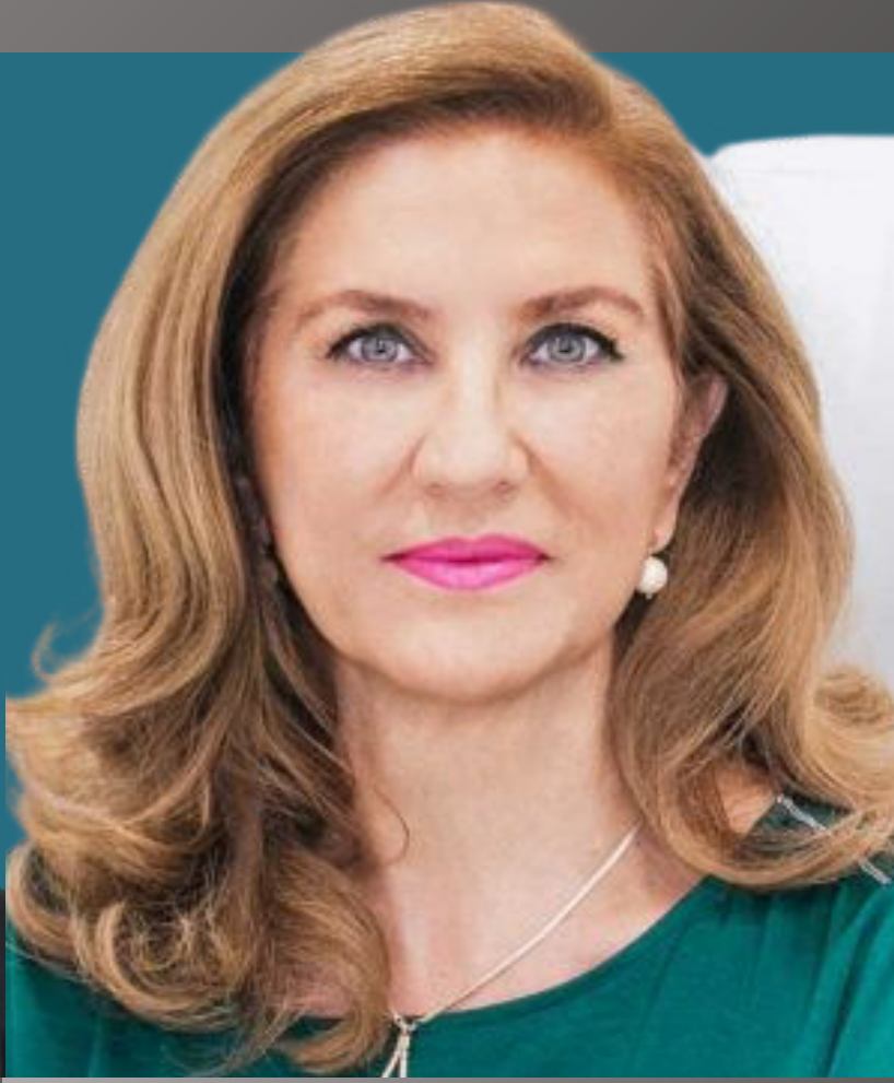
Dra. Lagüéns Experta en Medicina Estética y Cirugía